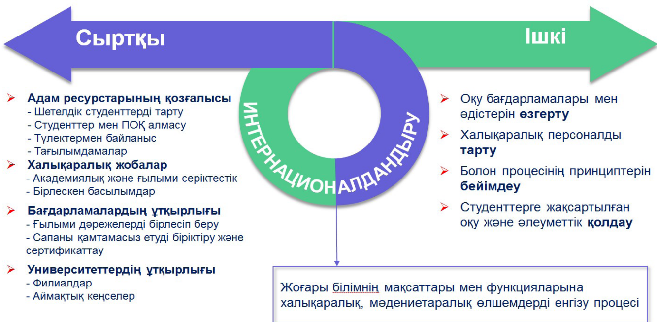
Сурет 4 - Сыртқы және ішкі интернационалдандыру