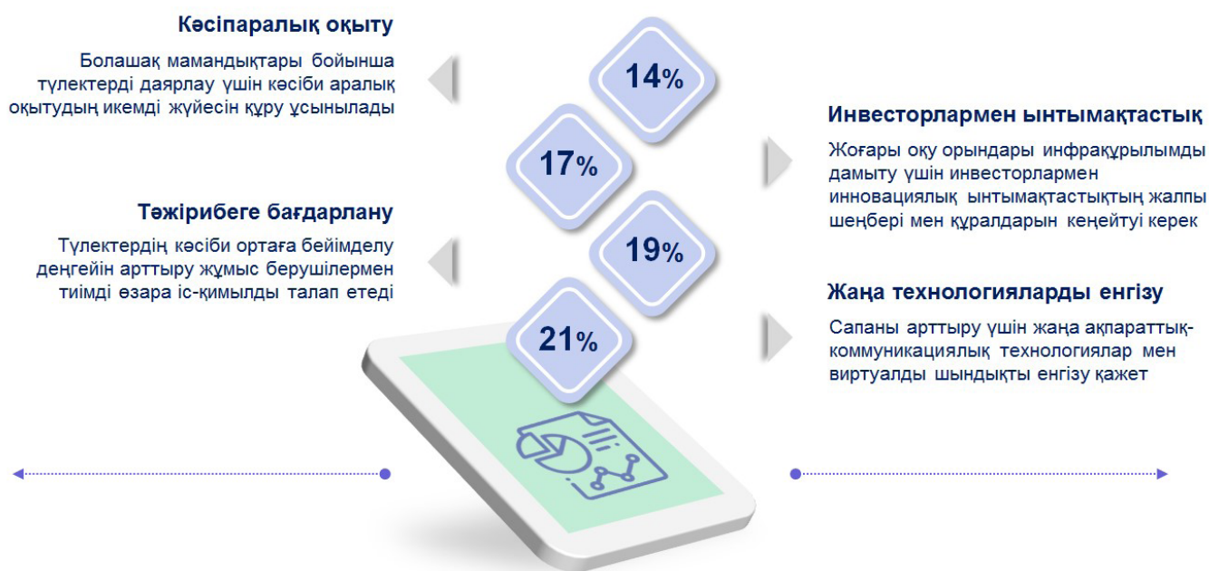
Сурет 3 - Жоғары білім сапасын талдау

Білім беру бағдарламасын интернационалдандыру: академиялық ұтқырлықты кеңейту, шетелдік студенттерге арналған бағдарламаны әзірлеу және шетелдік университетпен серіктестікте бірлескен бағдарламалар құру ретінде қарастырылады.