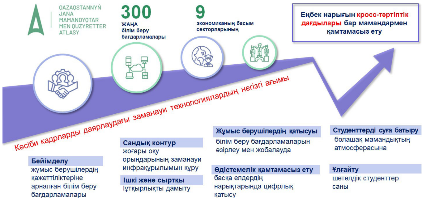
Сурет 1 - Еңбек нарығының сын қатерлері жағдайындағы жоғары оқу орындарының жаңа саясаты

Қазіргі уақытта білім беру қызметтерін даралау маңызды болып табылады, ол 5 жыл перспективасында құзыреттілікке сұраныс болжамына сүйене отырып, нақты уақыт режимінде құзыреттіліктерді талдауға мүм-