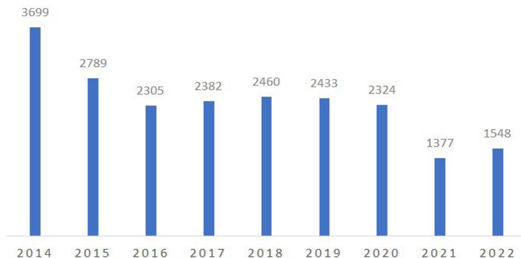
Сурет 1 - Қазақстанның тау-кен өнеркәсібіне Қытайдан жинақталған инвестициялардың динамикасы, млн. АҚШ доллары Ескерту - авторлар құрастырылған