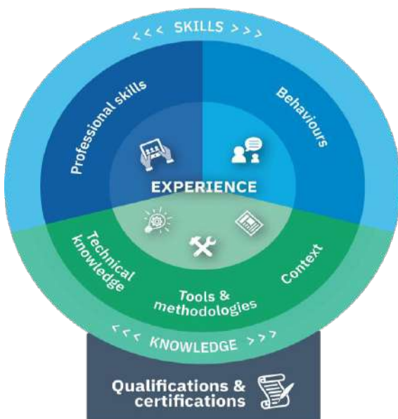
Figure 1 - Structure of human knowledge, skills, and competencies

Any job description, whether a job description or a person's assessment, includes several different aspects. The diagram illustrates the context for the different aspects that contribute to capacity.